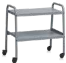
Serveringsvagn Arch Grey NCS 6502-B