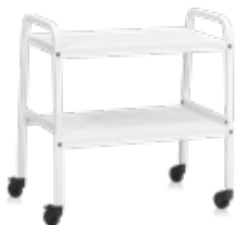
Serveringsvagn Arch White RAL 9016

Med facit i hand, tycker vi att vi verkligen har lyckats! Förutom att fungera som en ren serveringsvagn, passar Arch lika bra i skolan för transport eller förvaring av studiematerial som den gör som en stilren avlastningsyta på kontoret eller i konferenslokalen.