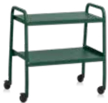
Serveringsvagn Arch Green RAL 6005