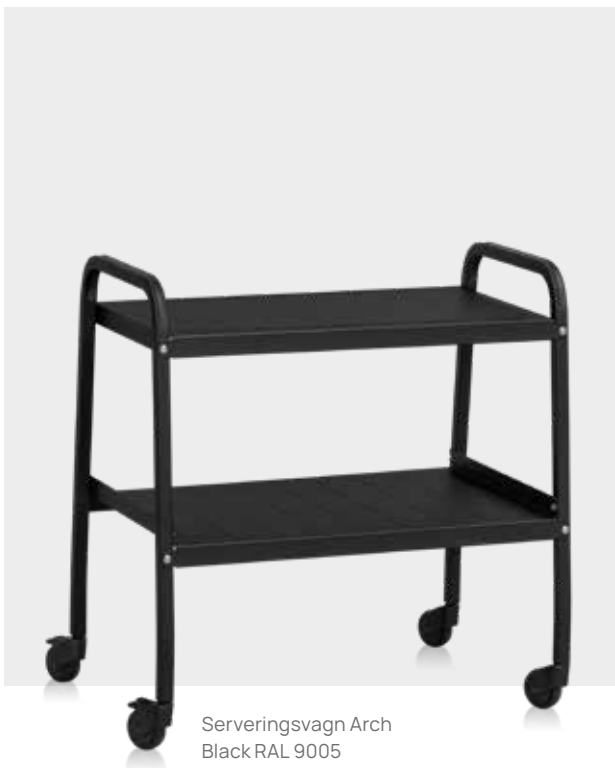
Serveringsvagn Arch Black RAL 9005

Arch kan fås även i andra färger på beställning.